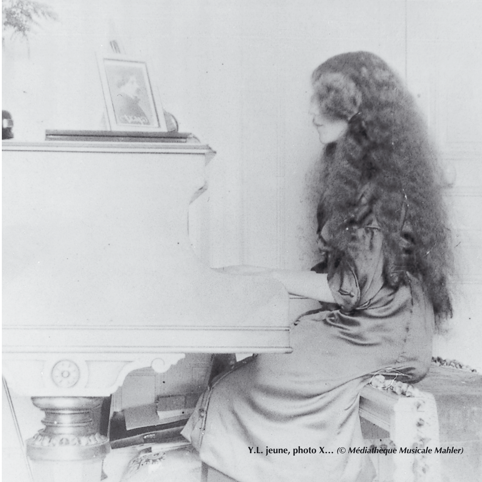
Y.L. jeune, photo X... (© Médiathèque Musicale Mahler)