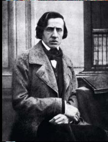
Frédéric Chopin, before 1849

With this concert I shall return to Warsaw. There are phrases that pierce straight into the heart. For, of course, he never did return. ~ He had left Poland before the nationalist uprising against Russian domination. And afterwards, he declared himself to the Russian authorities so unequivocally as a sympathiser of this brutally suppressed revolution that a return to his homeland would only have been possible to a liberated Poland. ~ That never came to be during his lifetime. ~ He decreed that after his death his body should be opened, his heart removed and buried in Warsaw. For at least that should return. ~ The 3rd Piano Concerto in A major, with which he wished to return home in triumph: today we only possess it in the form that Chopin himself – ten years later, when hope had faded – reworked as a solo piano piece (Allegro de concert). ~ The Boléro as the final movement was also published only as a piano piece, and its structure just as clearly reveals it to be a preliminary stage of a concerto movement. ~ Two works which, in their published versions, have never really gained popularity, for the representative, al-