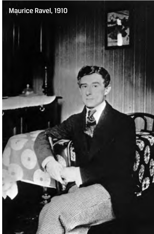
Maurice Ravel, 1910