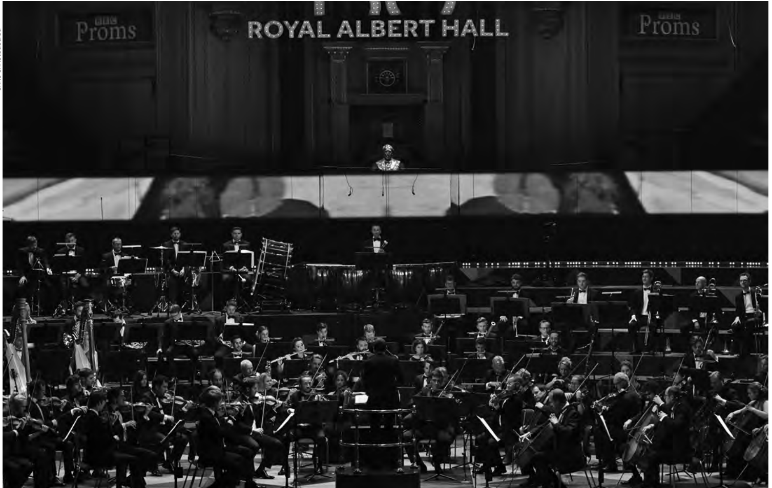
Sinfonia of London and John Wilson, at the BBC Proms, 4 September 2021