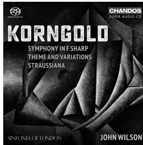
Korngold Symphony in F sharp • Theme and Variations • Straussiana CHSA 5220