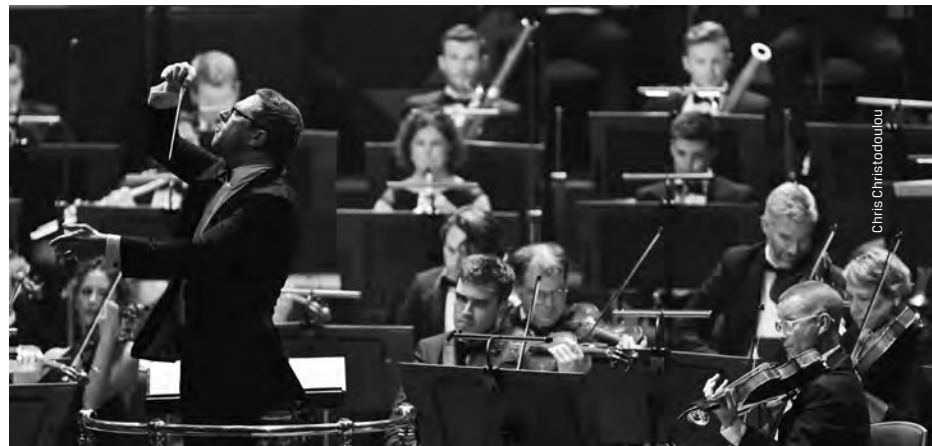
John Wilson and Sinfonia of London, at the BBC Proms, 4 September 2021

Die Fee Bénigne tritt auf und segnet das Paar. Apotheose Ende